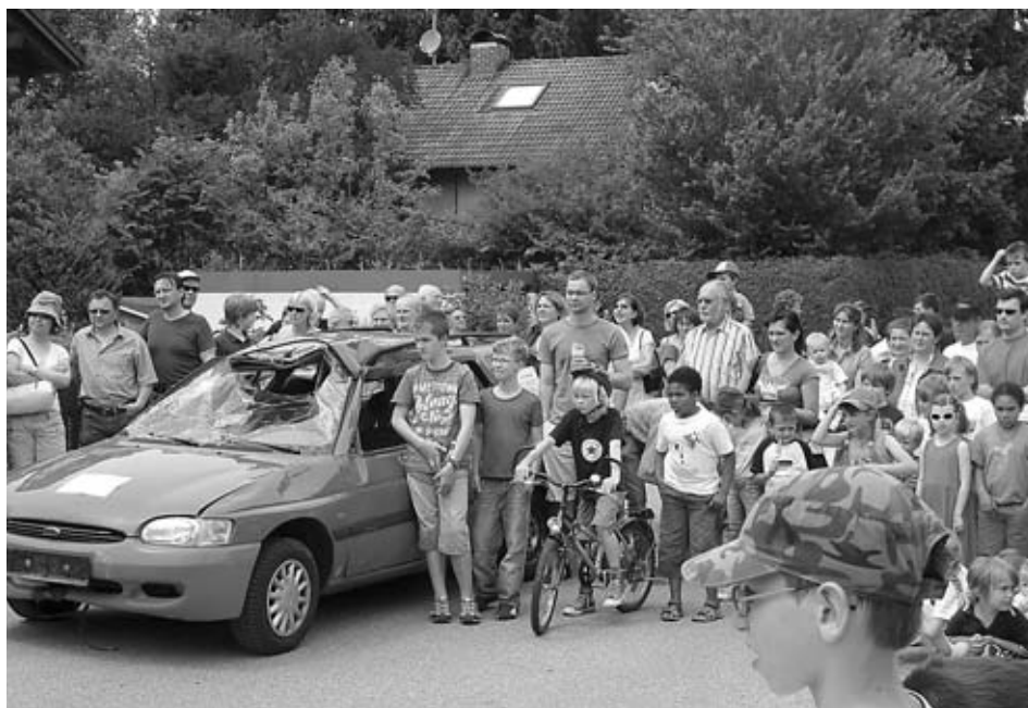
Gebannt blicken die Zuschauer aus sicherer Entfernung den gezeigten Experimenten zu. Was passiert gleich? Wie reagieren die verschiedenen Stoffe?

Diese Aufgabe muss die Feuerwehr bei Verkehrsunfällen übernehmen, um eingeklemmte Personen aus den Fahrzeugen zu befreien. Sie hat dafür spezielle Geräte wie Spreizer und Schere. Die Besucher der Veranstaltung konnten den Einsatz der genannten Hilfsmittel in der praktischen Anwendung sehen. Zum Retten der Personen wurde vom Unfallwagen das Dach mit der Rettungsschere abgeschnitten. Unter Aufsicht und Anleitung erfahrener Feuerwehrleute, war es Erwachsenen auch möglich, selbst mit den Geräten zur Personenbefreiung umzugehen.