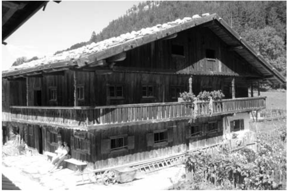
Bild oben: Das Wasmeier-Bauernhof-Museum Bild unten: Die Whiskeybrennerei

Treffpunkt für unseren Ausflug ist am 10.10.2009 pünktlich um 8.00 Uhr am S-Bahnsteig in Zorneding. Voranmeldung bei Karin Ossig (Tel. 08106 / 23 765 oder Karin.Ossig@gmx.de) bis 30. September 2009 ist zwingend erforderlich. Die Fahrt kostet einschließlich aller Eintrittsgelder 20 Euro (Nichtmitglieder 23 Euro; übrigens: auch Männer sind willkommen!). Kurz nach 18.00 Uhr werden wir wieder zurück sein.